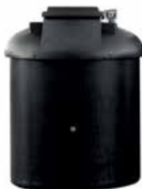
Depósitos para óleo usado