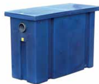
Separador de hidrocarbonetos

Na Mobilub, reconhecemos a importância de abordar a sustentabilidade no mercado global actual através do desenvolvimento social e da protecção ambiental. Só através de um desenvolvimento sustentável, as gerações futuras não estarão em perigo pelas acções tomadas hoje. Considerando esta evidência, dispomos de uma gama completa de equipamentos e produtos de qualidade que contribuem activamente para a preservação do Meio Ambiente e defesa dos recursos naturais, que satisfazem as necessidades de variados mercados e onde o cumprimento da legislação é também prioritário.