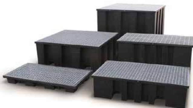
Bases de retenção