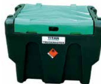
Depósitos para gasóleo

Todos estes equipamentos satisfazem as necessidades de variados mercados, onde os cuidados com o ambiente e o cumprimento da legislação são prioritários.