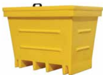
Caixas para armazenamento de baterias usadas

Não hesite em contactar-nos, temos a solução que procura!