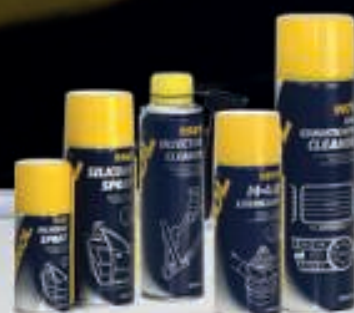
QUÍMICOS, ADITIVOS E PRODUTOS PARA CAR CARE

Tudo o que precisa para o seu automóvel, de Norte a Sul do país!